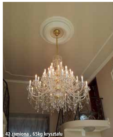
42 ramiona , 65kg kryształu