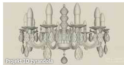
Projekt 3D żyrandola